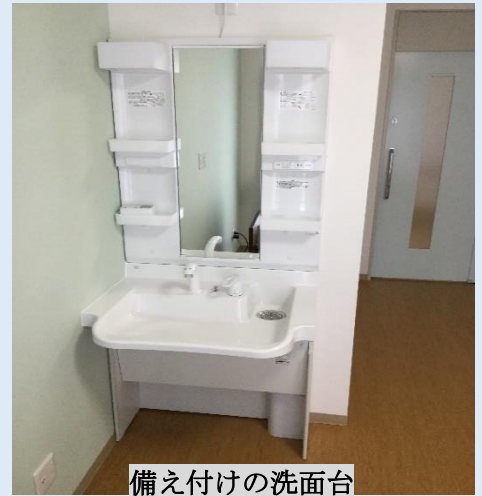
備え付けの洗面台