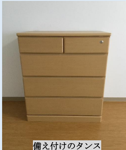
備え付けのタンス